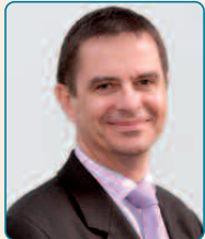
André-Paul Bahuon Président de l'Ordre des experts-comptables Paris Ile-de-France